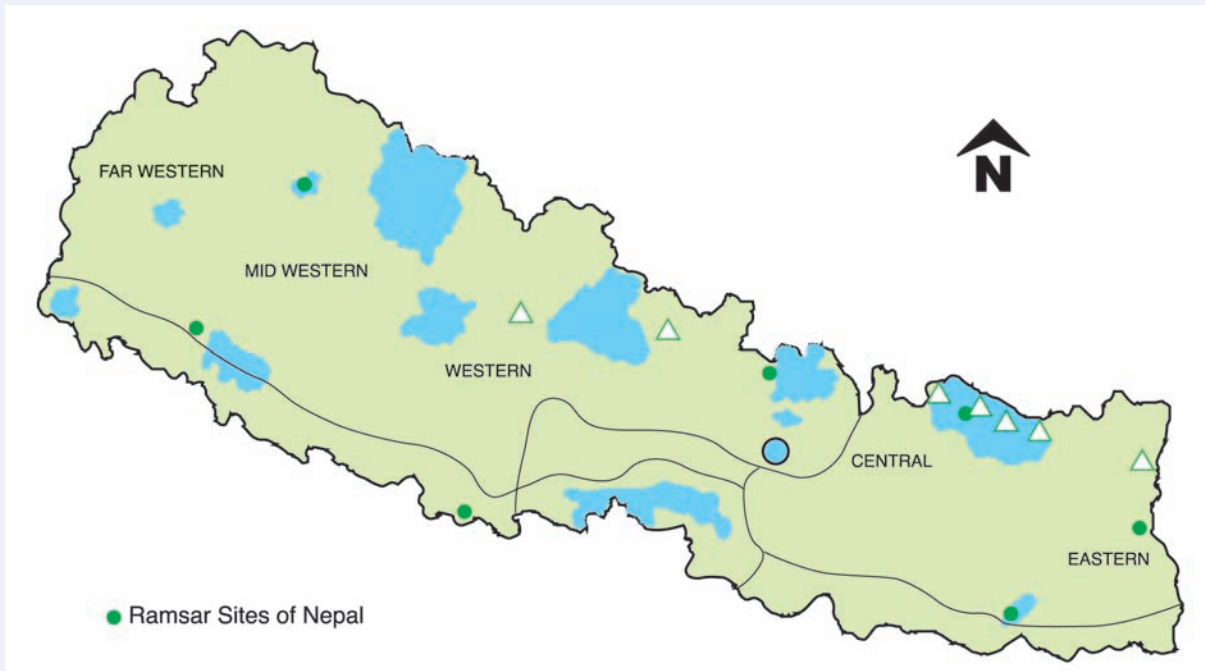
नक्सा १: नेपालको नक्सामा ९ वटा रामसार क्षेत्र